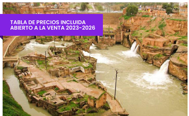
TABLA DE PRECIOS INCLUIDA ABIERTO A LA VENTA 2023-2026

Tour cultural superior de Irán: Teherán 2N, Ahwaz 2N, Shush & Shushtar, Shiraz 2N, Yazd 1N, Isfahan 3N, Kashan 1N, aeropuerto IKA 1N (12 noches/13 días)