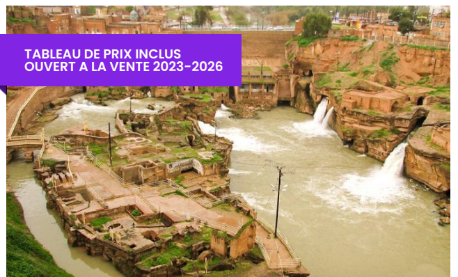
TABLEAU DE PRIX INCLUS OUVERT A LA VENTE 2023-2026

Iran Top Culture, Religieux + Nature Tour: Téhéran 2N, Kermanshah 2N, Mashhad 2N, Shiraz