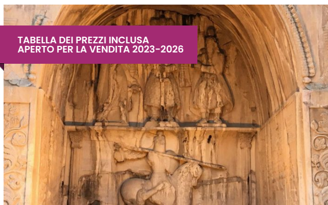
TABELLA DEI PREZZI INCLUSA APERTO PER LA VENDITA 2023-2026

Tour culturale, religioso e naturalistico dell'Iran: Teheran 2N, Kermanshah 2N, Mashhad 2N, Shiraz 3N, Kish Island 2N, Isfahan 2N, Abyaneh e Kashan, aeroporto IKA (14 notti/15 giorni)