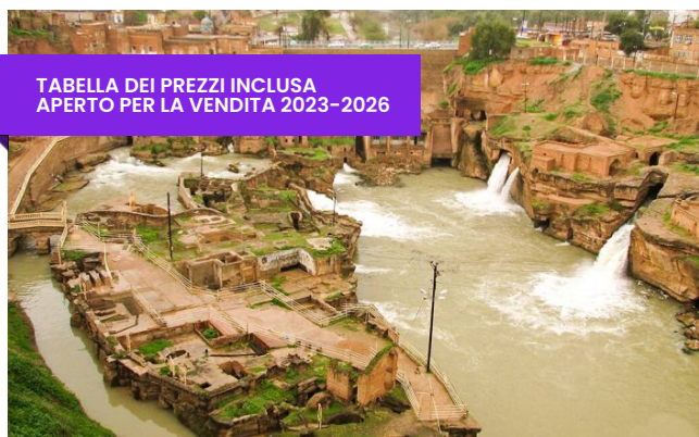
TABELLA DEI PREZZI INCLUSA APERTO PER LA VENDITA 2023-2026

Tour culturale top dell'Iran: Teheran 2N, Ahwaz 2N, Shush & Shushtar, Shiraz 2N, Yazd 1N, Isfahan 3N, Kashan 1 N, IKA airport 1N (12 notti/13 giorni)