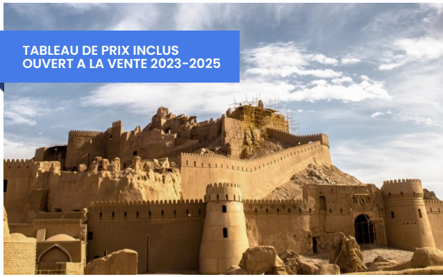
TABLEAU DE PRIX INCLUS OUVERT A LA VENTE 2023-2025

Tour classico dell'economia dell'Iran (Teheran, Kashan, Isfahan, Yazd, Shiraz, Kerman, Bam, Tehran) 13 giorni-12 notti