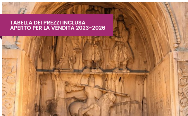
TABELLA DEI PREZZI INCLUSA APERTO PER LA VENDITA 2023-2026

Tour culturale, religioso e naturalistico dell'Iran: Teheran 2N, Kermanshah 2N, Mashhad 2N, Shiraz