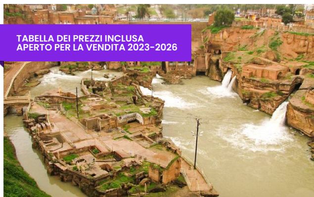
TABELLA DEI PREZZI INCLUSA APERTO PER LA VENDITA 2023-2026

Tour culturale, religioso e naturalistico dell'Iran: Teheran 2N, Kermanshah 2N, Mashhad 2N, Shiraz