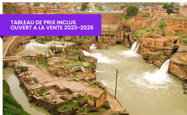
Iran Top Culture Tour: Téhéran 2N, Ahwaz 2N, Shush & Shushtar, Shiraz 2N, Yazd 1N, Ispahan