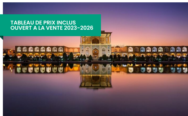
Iran Top Culture Tour-Ira Tour: Shiraz 3 nuits, Yazd 1 nuit, Ispahan 2 nuits,