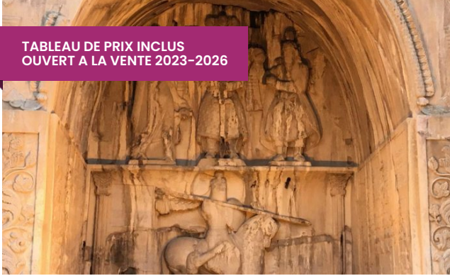
TABLEAU DE PRIX INCLUS OUVERT A LA VENTE 2023-2026

Iran Top Culture, Religieux + Nature Tour: Téhéran 2N, Kermanshah 2N, Mashhad 2N, Shiraz 3N, Kish Island 2N, Ispahan 2N, Abyaneh & Kashan, aéroport IKA (14 nuits/15 jours)