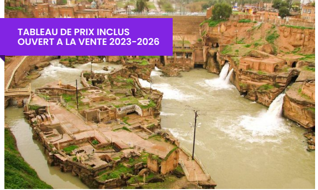
TABLEAU DE PRIX INCLUS OUVERT A LA VENTE 2023-2026

Iran Top Culture, Religieux + Nature Tour: Téhéran 2N, Kermanshah 2N, Mashhad 2N, Shiraz 3N, Kish Island 2N, Ispahan 2N, Abyaneh & Kashan, aéroport IKA (14 nuits/15 jours)