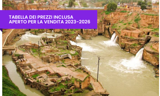
TABELLA DEI PREZZI INCLUSA APERTO PER LA VENDITA 2023-2026

Tour culturale, religioso e naturalistico dell'Iran: Teheran 2N, Kermanshah 2N, Mashhad 2N, Shiraz 3N, Kish Island 2N, Isfahan 2N, Abyaneh e Kashan, aeroporto IKA (14 notti/15 giorni)