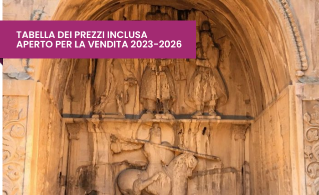
TABELLA DEI PREZZI INCLUSA APERTO PER LA VENDITA 2023-2026

Tour culturale, religioso e naturalistico dell'Iran: Teheran 2N, Kermanshah 2N, Mashhad 2N, Shiraz 3N, Kish Island 2N, Isfahan 2N, Abyaneh e Kashan, aeroporto IKA (14 notti/15 giorni)