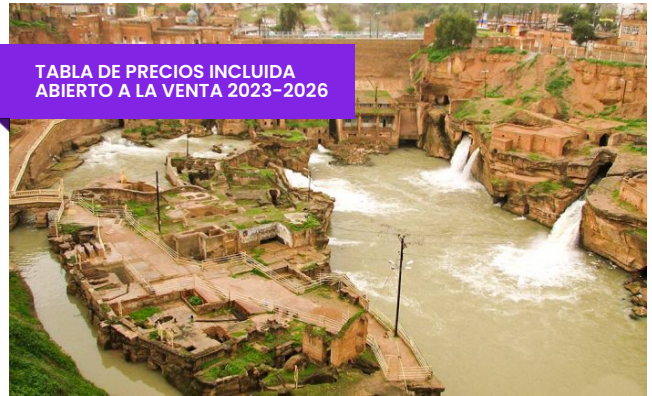
TABLA DE PRECIOS INCLUIDA ABIERTO A LA VENTA 2023-2026

Recorrido cultural, religioso y natural de Irán: Teherán 2N, Kermanshah 2N, Mashhad 2N, Shiraz 3N, Isla Kish 2N, Isfahan 2N, Abyaneh y Kashan, aeropuerto IKA (14 noches/15 días)