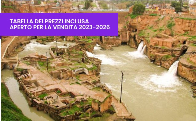
TABELLA DEI PREZZI INCLUSA APERTO PER LA VENDITA 2023-2026

Tour culturale top dell'Iran: Teheran 2N, Ahwaz 2N, Shush & Shushtar, Shiraz 2N, Yazd 1N, Isfahan 3N, Kashan 1 N, IKA airport 1N (12 notti/13 giorni)