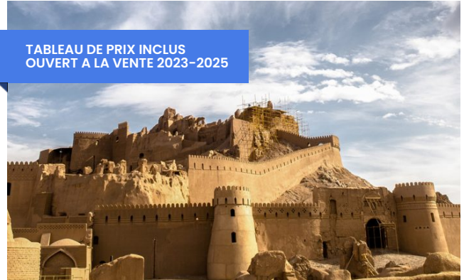
TABLEAU DE PRIX INCLUS OUVERT A LA VENTE 2023-2025

Tour culturale top dell'Iran: Teheran 2N, Ahwaz 2N, Shush & Shushtar, Shiraz 2N, Yazd 1N, Isfahan 3N, Kashan 1 N, IKA airport 1N (12 notti/13 giorni)