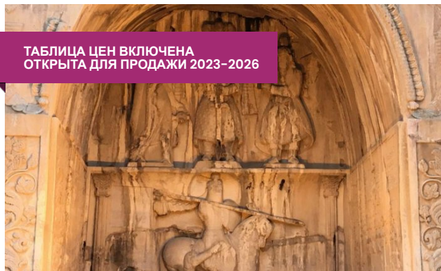
ТАБЛИЦА ЦЕН ВКЛЮЧЕНА ОТКРЫТА ДЛЯ ПРОДАЖИ 2023-2026

Культурный, религиозный и природный тур по Ирану: Тегеран 2N, Керманшах 2N, Мешхед 2N, Шираз 3N, остров Киш 2N, Исфахан 2N, Абыяне и Кашан, аэропорт ИКА (14 ночей / 15 дней)