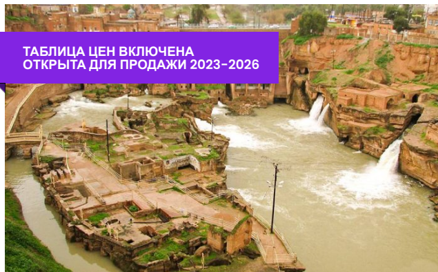
ТАБЛИЦА ЦЕН ВКЛЮЧЕНА ОТКРЫТА ДЛЯ ПРОДАЖИ 2023-2026

Культурный, религиозный и природный тур по Ирану: Тегеран 2N, Керманшах 2N, Мешхед 2N, Шираз 3N, остров Киш 2N, Исфахан 2N, Абыяне и Кашан, аэропорт ИКА (14 ночей / 15 дней)