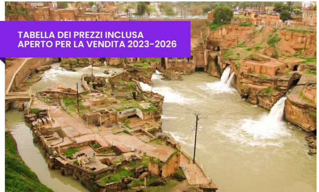
TABELLA DEI PREZZI INCLUSA APERTO PER LA VENDITA 2023-2026

Tour culturale, religioso e naturalistico dell'Iran: Teheran 2N, Kermanshah 2N, Mashhad 2N, Shiraz 3N, Kish Island 2N, Isfahan 2N, Abyaneh e Kashan, aeroporto IKA (14 notti/15 giorni)