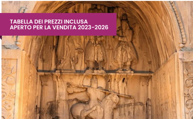
TABELLA DEI PREZZI INCLUSA APERTO PER LA VENDITA 2023-2026

Tour culturale, religioso e naturalistico dell'Iran: Teheran 2N, Kermanshah 2N, Mashhad 2N, Shiraz 3N, Kish Island 2N, Isfahan 2N, Abyaneh e Kashan, aeroporto IKA (14 notti/15 giorni)