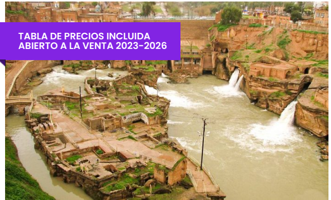
TABLA DE PRECIOS INCLUIDA ABIERTO A LA VENTA 2023-2026

Recorrido cultural, religioso y natural de Irán: Teherán 2N, Kermanshah 2N, Mashhad 2N, Shiraz 3N, Isla Kish 2N, Isfahan 2N, Abyaneh y Kashan, aeropuerto IKA (14 noches/15 días)