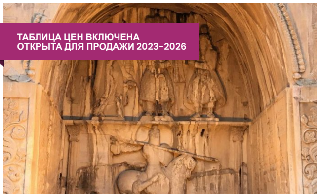
ТАБЛИЦА ЦЕН ВКЛЮЧЕНА ОТКРЫТА ДЛЯ ПРОДАЖИ 2023-2026

Культурный, религиозный и природный тур по Ирану: Тегеран 2N, Керманшах 2N, Мешхед 2N,