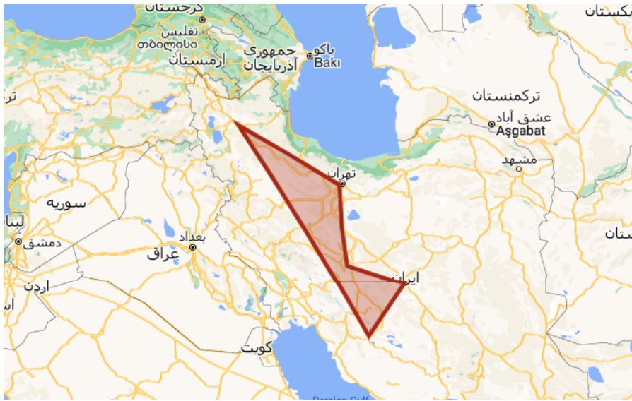
사진 - 이란 탐 투어, 15일/14박 - 이란 탐 클래식 투어, 이란 문화 투어